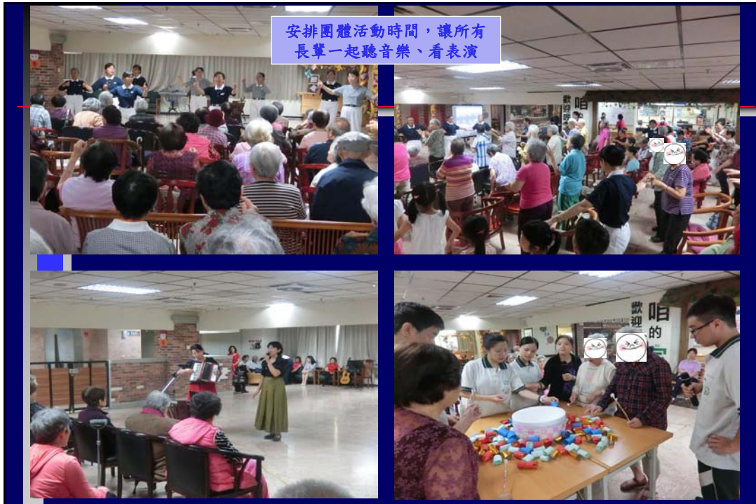
安排團體活動時間，讓所有 長輩一起聽音樂、看表演